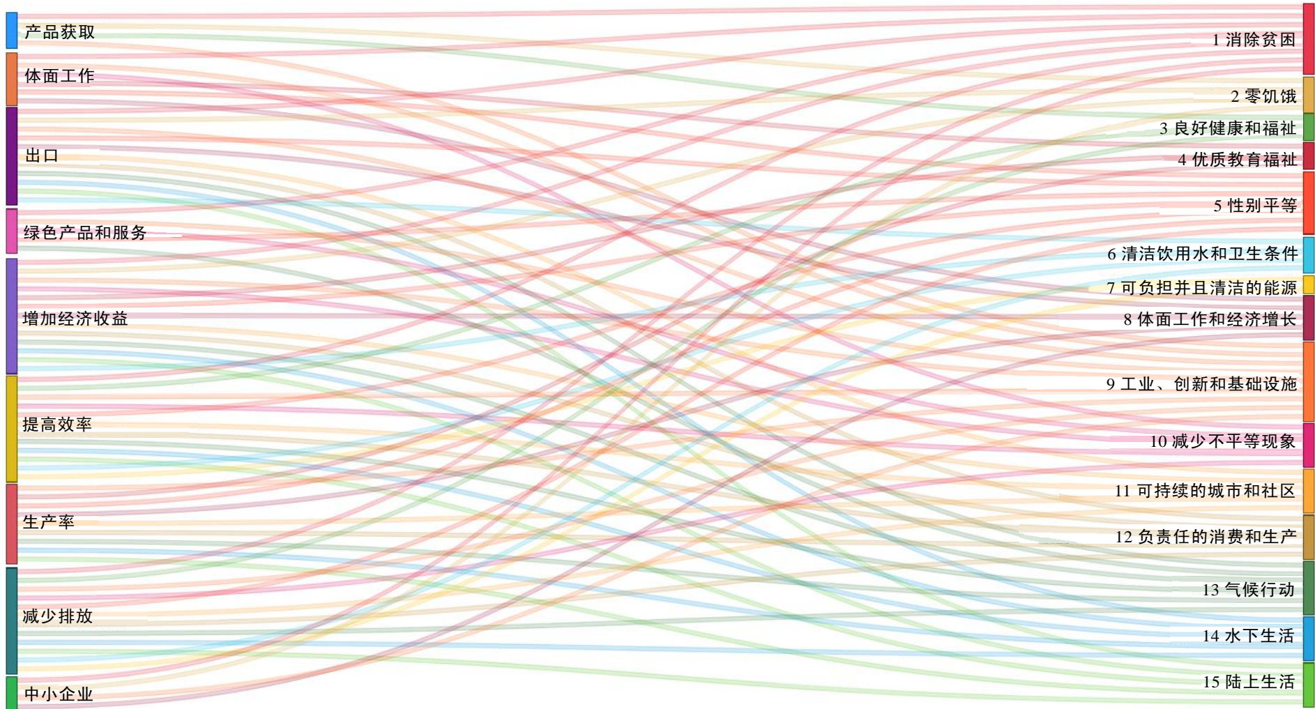
(b) 纯粹基于包容及可持续工业发展与可持续发展目标的系数矩阵，规划包容及可持续工业发展影响力领域与可持续发展目标 1-15 之间的相互联系